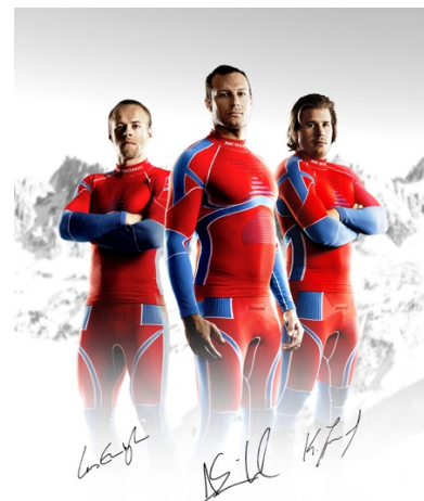
5 | 19 Mal stand X-SOCKS® mit auf dem Siegerpodest

X-SOCKS® erhält seine Anerkennung auch auf dem asiatischen Markt. Kompetenz entwickelt in der Schweiz, hergestellt in Italien erhält X-SOCKS® den begehrten iF Design Award China für außergewöhnliches Design.