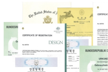
2 | X-SOCKS® - über 414 Patenteintragungen und Gebrauchsmuster