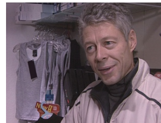
3 | Dr. Thomas Wessinghage

Zum ersten Mal wird X-SOCKS® öffentlich herausgefordert. Fit for Fun TV (VOX/Deutschland) wollte es genau wissen und beauftragte den ehemaligen Europameister Dr. Thomas Wessinghage mit der Entwicklung eines Leistungsvergleichstests für Sportsocken. Das Ergebnis kann kaum eindeutiger sein. 19 von 20 Sportlern wählten X-SOCKS® aus einer Auswahl von über 50 Sportsocken führender Hersteller (Nike, Rohner, Tao, Falke etc.) zu ihrem klaren Favoriten.