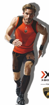
4 | X-BIONIC® Weltmarktführer für hochtechnologische Sportbekleidung